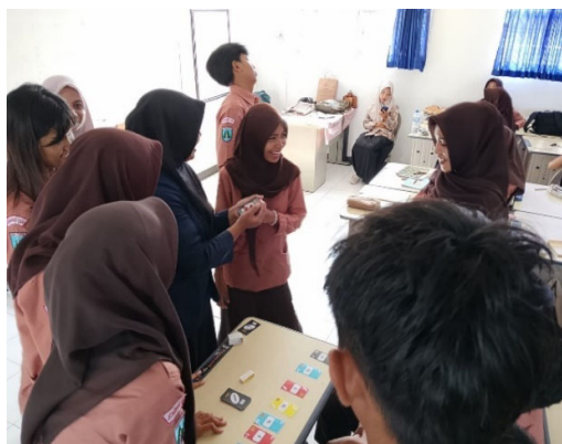
Gambar 2. Penerapan Media X-PAKAR dan Math Board Card

Kegiatan pengabdian kepada masyarakat ini diawali dengan tahap persiapan yang dilaksanakan pada 19 November 2025 di perpustakaan SMA PGRI 1 Jombang bersama guru matematika kelas X-2. Pada tahap ini dilakukan observasi kelas dan wawancara untuk mengidentifikasi kebutuhan pembelajaran matematika, khususnya pada materi eksponen dan akar pangkat. Hasil identifikasi menunjukkan bahwa karakteristik siswa kelas X-2 sangat beragam dari segi kemampuan akademik, gaya belajar, dan tingkat partisipasi. Sebagian siswa tampak aktif dan antusias, namun sebagian lainnya cenderung pasif selama proses pembelajaran. Selain itu, ditemukan bahwa siswa masih mengalami kesulitan memahami konsep dasar bilangan berpangkat dan akar pangkat, serta belum tersedia media pembelajaran yang mampu memvisualisasikan konsep secara konkret dan menarik. Berdasarkan temuan tersebut, tim pengabdian merancang media pembelajaran X-PAKAR dan Math Board Card yang disesuaikan dengan karakteristik siswa, kemudian media yang telah disusun divalidasi untuk memastikan kesesuaian materi, kejelasan aturan permainan, serta keterpakaian dalam pembelajaran di kelas.