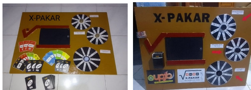
Gambar 1. Media X-PAKAR dan Math Board Card

kemauan belajar siswa. Media yang tepat membantu proses interaksi antara guru dan siswa sehingga pembelajaran berlangsung lebih efektif [7]. Dukungan serupa juga dikemukakan Maharani & Hidayah Putri [8], bahwa media pembelajaran memiliki andil besar dalam keberhasilan proses belajar mengajar. Media pembelajaran sebagai alat bantu bertujuan menyampaikan materi secara tepat kepada peserta didik sehingga lebih mudah dipahami [9]. Salah satu bentuk media yang berkembang pesat adalah game edukasi. Game edukasi dirancang untuk membuat proses belajar lebih menyenangkan, kreatif, dan efektif [10], dengan menggabungkan unsur bermain dan belajar sehingga peserta didik lebih tertarik dan mudah memahami materi [11]. Bahkan game dapat menghadirkan pengalaman belajar yang berbeda dari metode konvensional, sehingga memberikan dampak positif bagi proses pendidikan [12]. Sejalan dengan pendekatan tersebut, dikembangkanlah media X-PAKAR dan Math Board Card sebagai inovasi pembelajaran matematika yang bersifat edukatif dan interaktif. Media ini mengintegrasikan konsep board game dan kartu soal berbasis barcode atau QR Code sebagai sarana akses mandiri untuk penjelasan konsep maupun pembahasan soal [13]. Dalam Math Board Card, papan permainan digunakan untuk memvisualisasikan konsep, sedangkan kartu berisi soal-soal eksponen dan akar pangkat sesuai kurikulum SMA.