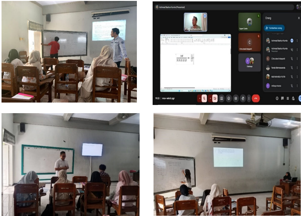
Gambar 2. Pelaksanaan Pembinaan dan Pendampingan ONMIPA-PT

Untuk mengetahui keberhasilan kegiatan pembinaan dan pendampingan ONMIPA-PT tahun 2026 di Universitas PGRI Jombang, pembimbing memberikan pretest dan posttest untuk membandingkan kemampuan mahasiswa sebelum dan sesudah. Adapun hasilnya ditunjukkan pada Gambar 3 berikut.