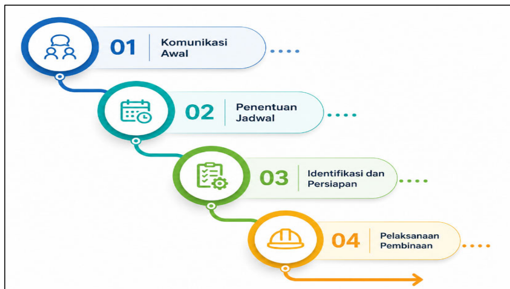
Gambar 1. Metode pelaksanaan kegiatan

Pada tahap daring, fokus pembelajaran diarahkan pada materi kombinatorika, seperti aturan penjumlahan, aturan perkalian, permutasi, dan kombinasi, disertai latihan soal sederhana untuk mengukur pemahaman mahasiswa. Sementara itu, kegiatan luring lebih menekankan pada pendalaman materi kombinatorika serta pengenalan topik lain, seperti aljabar linear dan analisis real. Untuk mendukung proses pembelajaran, disediakan pula materi tambahan melalui platform daring yang memuat soal-soal beserta pembahasan lengkap. Melalui pendekatan ini, diharapkan pembinaan tidak hanya meningkatkan pemahaman mahasiswa terhadap materi yang diujikan dalam ONMIPA-PT, tetapi juga membekali mahasiswa secara mental dan akademik agar mampu bersaing secara optimal dalam kompetisi tersebut. Adapun metode pelaksanaan kegiatan ditunjukkan pada gambar berikut.