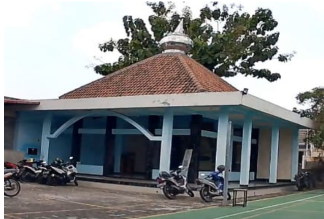
Gambar 2. Masjid Qolbun Salim